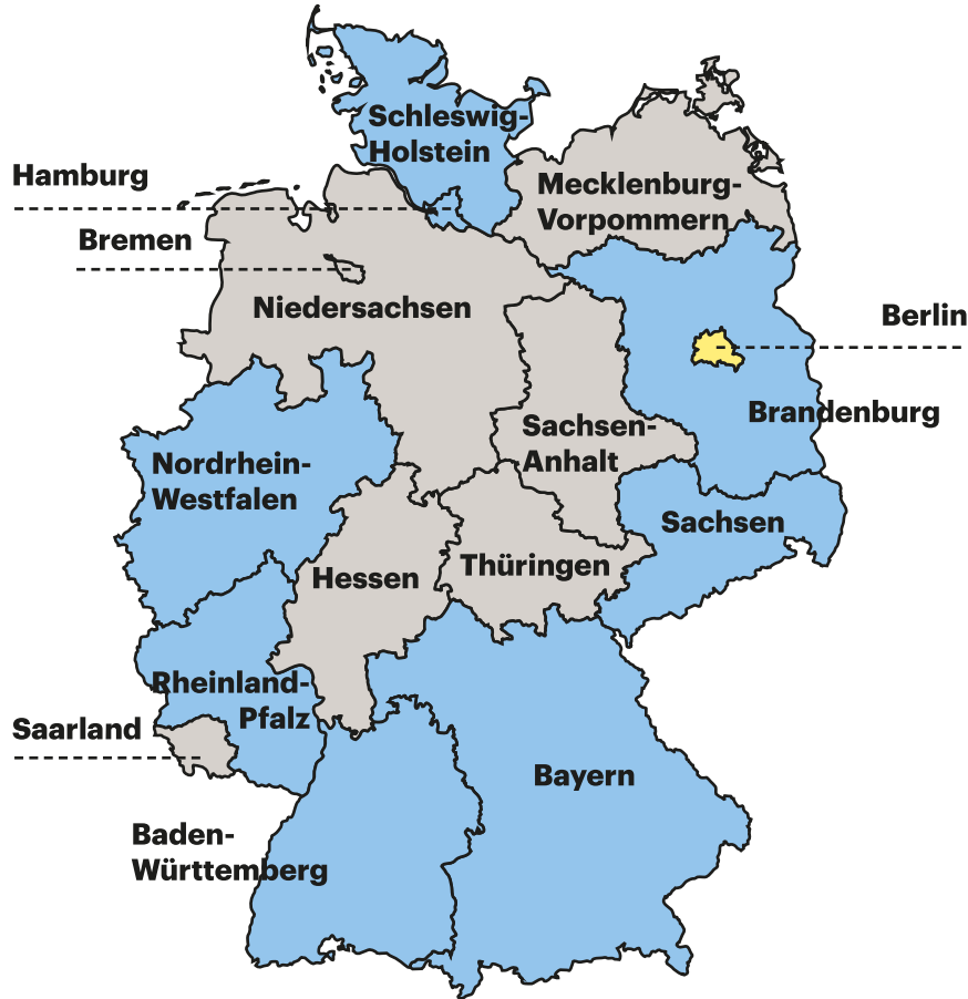
Anteil am Portfolio (in%)

Portfoliosplit Bundesländer Gesamtbestand per 31.12.2025, Basis Sollmiete