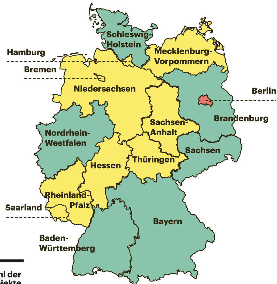
Anteil am Portfolio (in%)